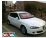
147 צורה חדשה 150 כ"ס מאובזרת