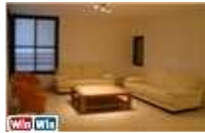
נוף לים וריהוט מלא !