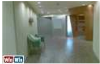
1000 מ' ליד לעזראלי