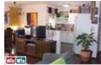
עם מרפסת וחניה