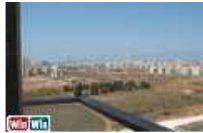
עם מרפסת ענקית