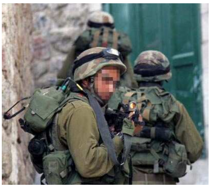
לא רק פציעות, גם מחלות שקרו בשירות הן עילה לתביעה

לדברי עו"ד ענת גינזבורג, "השאלה המרכזית היא האם קיים קשר סיבתי בין המחלה או הנכות לבין תנאי השירות. על החייל להוכיח כי הנכות נגרמה תוך כדי השירות הצבאי או עקב תנאי השירות. חיילים רבים מתגייסים לצה"ל בריאים לחלוטין, לעתים קרובות בפרופיל 97, ומסיימים את שירותם כשהם סובלים מנכות, ולעתים אף משוחררים מצה"ל בפרופיל 24 עקב הנכות בה לקו תוך כדי ועקב השירות.