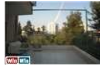
8 חדרים בירושלים