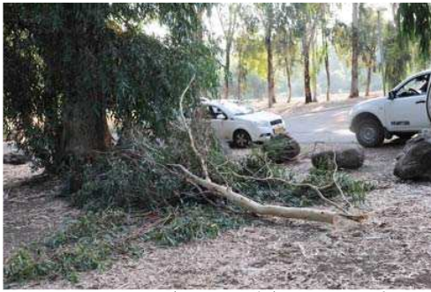
עצי האייליפטוס בפארק הירדן

המשפחה תובעת פיצויים בגין ההוצאות, ההפסדים והזקק הכללי שנגרם. "לא ניתן לתאר את הסבל הנורא שפקד את אלראי ומשפחתו ברגעיו האחרונים עד לפטירתו", טען בתביעה. "במותו השאיר אחריו משפחה שלמה שחיה נפצו לרסיסים ולא יתאחו עוד לעולם".