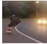
גלש בסקייטבורד ב-110 קמ"ש ויכנס לכלא?