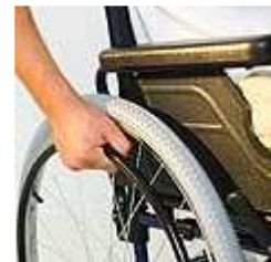
לא הסכימה לשלם את מלוא מחיר האביזרים

השופטת ממשיכה ומבהירה את חומרת הדברים: "הנחת הפסיק במקום זה, יתכן ומשרתת את הפרשנות של הנתבעת, אולם הנתבעת אינה רשאית להוסיף פסיקים ונקודות לפוליסה בדיעבד על מנת לשנות את המשמעות המקורית שלה". בשל כך, דחתה השופטת את טענותיה של חברת הביטוח "הפניקס" ופסקה כי תשלם למבוטח 625 אלף שקלים, שווי עלות הרכב והאביזרים המיוחדים שהותקנו בו.