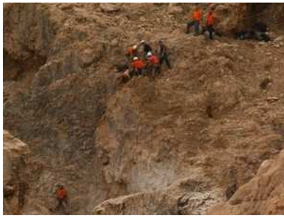
חילוף גופותיהם של הנספים בנחל קומראן ב-2007

ארבע שנים וחצי אחרי שארבעה מטיילים נספו בשיטפון העז שפקד את נחל קומראן במדבר יהודה, אישר בית המשפט המחוזי בירושלים הסדר פשרה בין רשות הטבע והגנים לבין משפחותיהם של עמית גוטליב, דרור קורן, טל אלון ונועה שפירא. לפי ההסדר, הרשות תפצה את המשפחות בסכום של 4.5 מיליון שקלים, וכן תקבע שהיא אשמה במחדלים שהביאו למותם של ארבעת הצעירים.