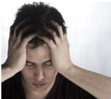
רבים נתקלים ביחס האטום של המוסד לביטוח לאומי