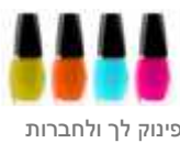
פינוק לך ולחברות