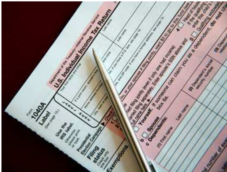
חשוב להקדיש זמן למילוי טפסי התביעה ולמלא אותם כראוי.

* אופן הגשת התביעה למוסד לביטוח לאומי בגין מחלת מקצוע/ מיקרוטרומה זהה להליך הגשת תביעה בגין תאונת עבודה.