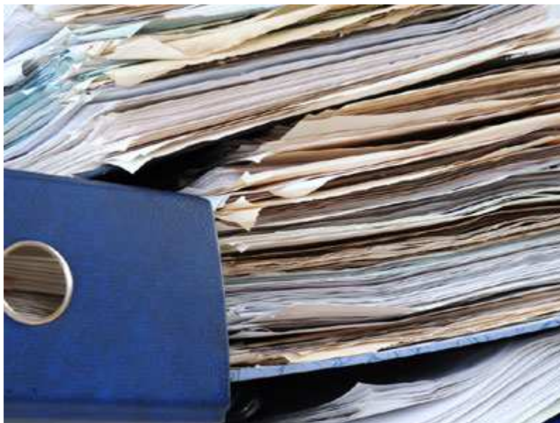
אחוז לא קטן מבין אלפי התביעות המוגשות לביטוח לאומי, נדחה.

אז באילו מקרים יש לכם עילה לתביעה לביטוח לאומי? איך מגישים תביעה? ממה צריך להיזהר? על מה חשוב להקפיד? להלן עיקרי התשובות.